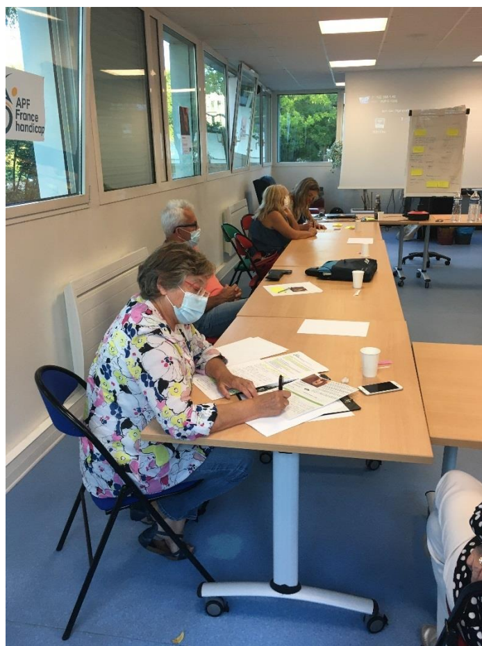
Poursuite du temps de réflexion sur les besoins identifiés et la formulation de propositions