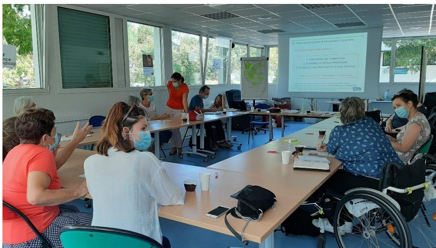
Poursuite du temps de réflexion collective sur des propositions d'amélioration formulées par les aidant.e.s et membres représentant.e.s d'associations présent.e.s