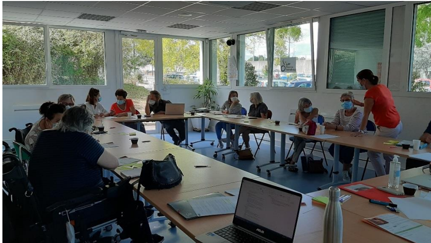
Aidant.e.s et membres représentant.e.s d'associations présent.e.s rédigeant une (des) proposition(s) lors de ce temps de rencontre