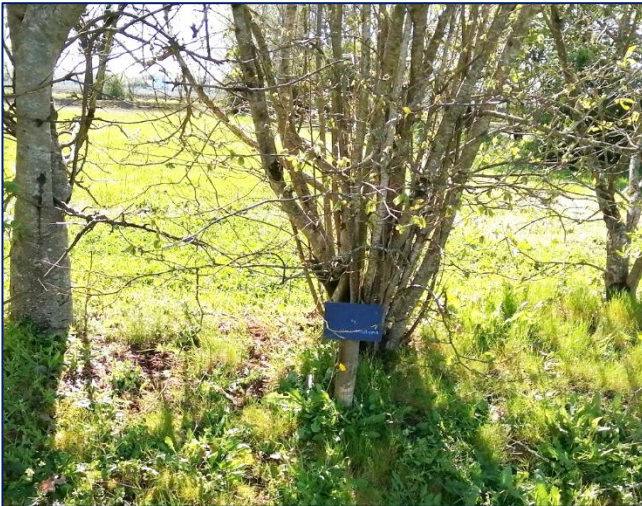
Actuel et Projet

450€ pièce ( http://www.citer-publicite.com/sentier.html )