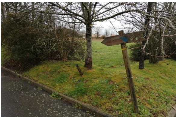
Actuel et Projet

http://www.citer-publicite.com/sentier.html