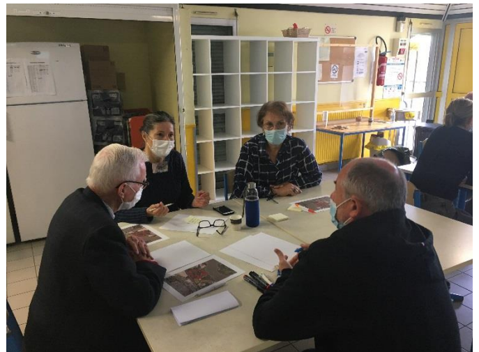
Figure 1 : Participant·e·s réfléchissant ensemble aux problématiques de cohabitation des usages