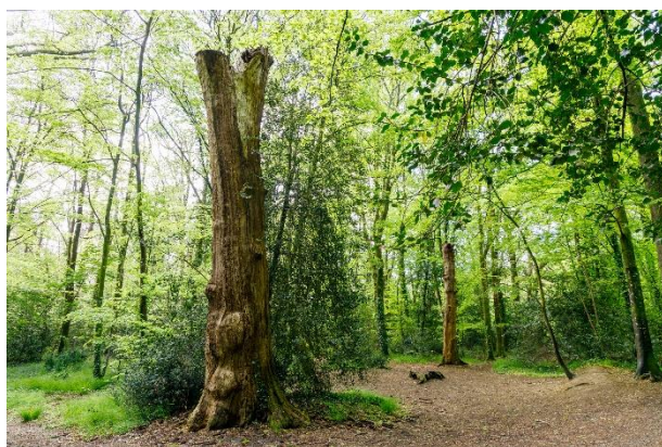
Figure 12 : Deux arbres totems - Paul PASCAL, le 5 mai 2021

Sur l'une des balades notamment, beaucoup de questions ont été posées sur l'Office National des Forêts (ONF) et son rôle dans le bois de la Desnerie.