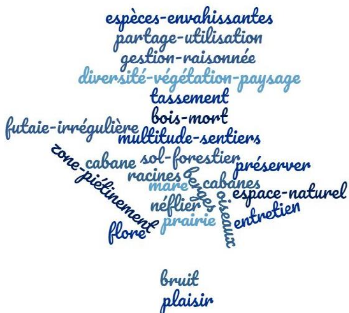
Figure 15 : Mots ajoutés au nuage de mots après les balades. Plus la taille des mots est importante, plus ils ont été cités par les participants

Puis un moment a été pris pour compléter le nuage de mots commencé avant la balade.