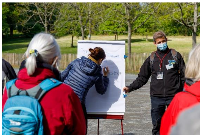
Figure 4 : Ecriture des premiers mots qui viennent à l'esprit des promeneurs quand ils pensent au bois de la Desnerie

En début de balade, les mots les plus cités font partis du champ sémantique des loisirs ou activités sportives, comme la balade ou le vélo. Le bois est un lieu qui permet de s'oxygéner, de profiter de l'air extérieur. L'Erdre est un élément important, qui apparaît comme caractéristique du bois. Des références sont faites à la nature, mais elles se font plus discrètes.