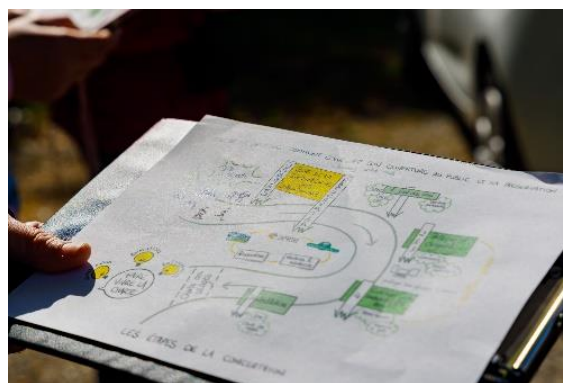
Figure 1 : Facilitation graphique présentant la démarche menée sur le bois de la Desnerie - Paul PASCAL, le 5 mai