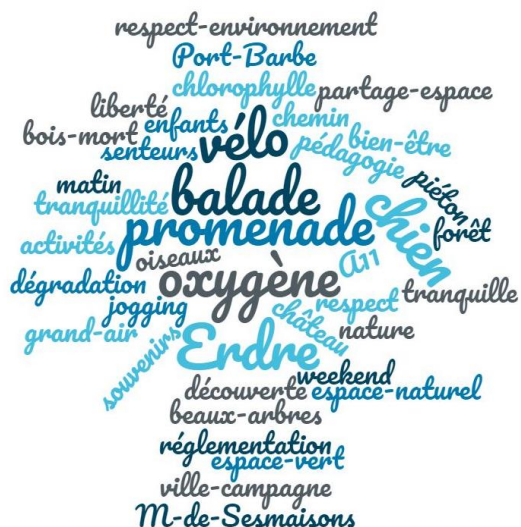
Figure 3 : Nuage de mots avant de partir en balade. Plus la taille des mots est importante, plus ils ont été cités par les participants

S'en est suivi un premier atelier qui avait pour objectif de connaître les images qu'évoque le bois auprès des participants avant la balade. Les participants ont donné des mots qui leur venaient à l'esprit à l'évocation du bois de la Desnerie. Le nuage de mots suivant est le résultat de cet atelier.