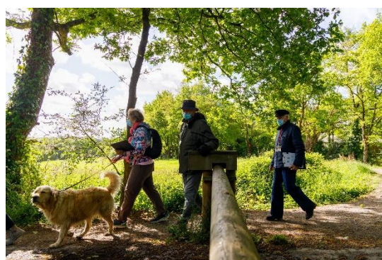
Figure 5 : Départ de la balade sur le chemin du haut

Plusieurs arrêts communs ont jalonné ces balades et ont été le moment de petits ateliers.