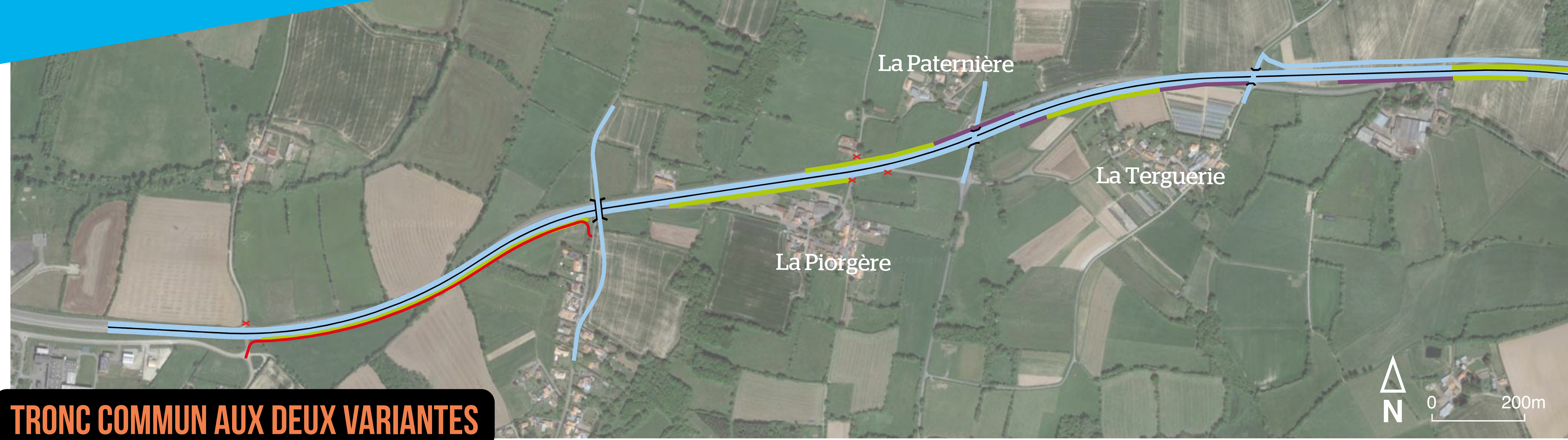
TRONC COMMUN AUX DEUX VARIANTES

Les longueurs des protections présentées sont des ordres de grandeur et ont été déterminées de manière à respecter les seuils réglementaires. Lorsqu'une variante sera retenue, les caractéristiques et longueurs précises seront approfondies dans le cadre d'une nouvelle étude spécifique.