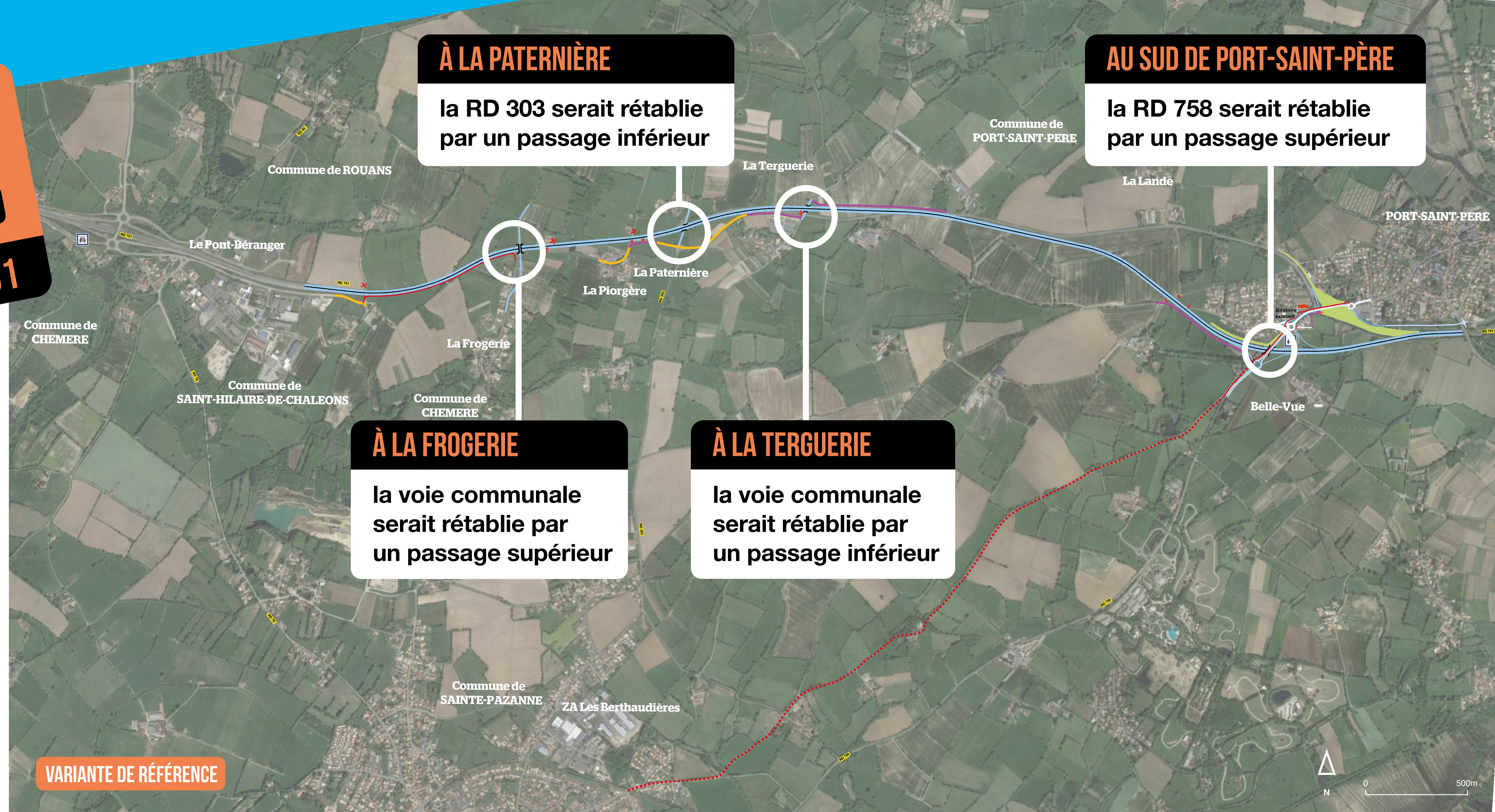
VARIANTE DE RÉFÉRENCE

Dans le cadre du projet de mise à 2x2 voies de la RD 751, le Département prend en compte les modes de déplacement alternatifs à la voiture individuelle : qu'il s'agisse des modes actifs (marche à pied, vélo...) ou du covoiturage et du transport en commun pour limiter l'autosolisme (fait d'être seul dans sa voiture).