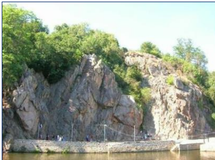
Caffino rive gauche

Rive gauche, sur la commune de Château-Thébaud, on trouve des voies d'initiation et d'escalade tous niveaux.