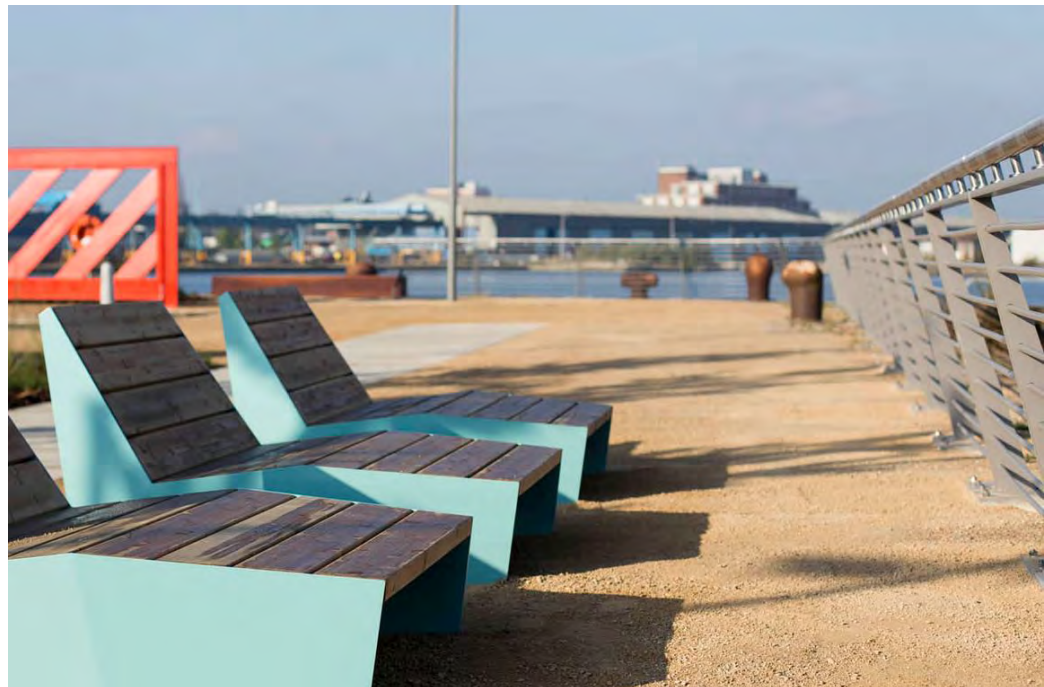
Front de mer de Liverpool BCA Landscape