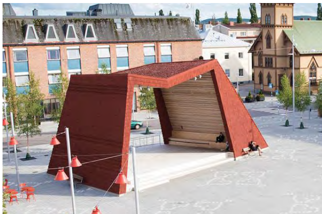
Kiosque place centrale de Bollnäs, Suède Karavan landskapsarkitekter