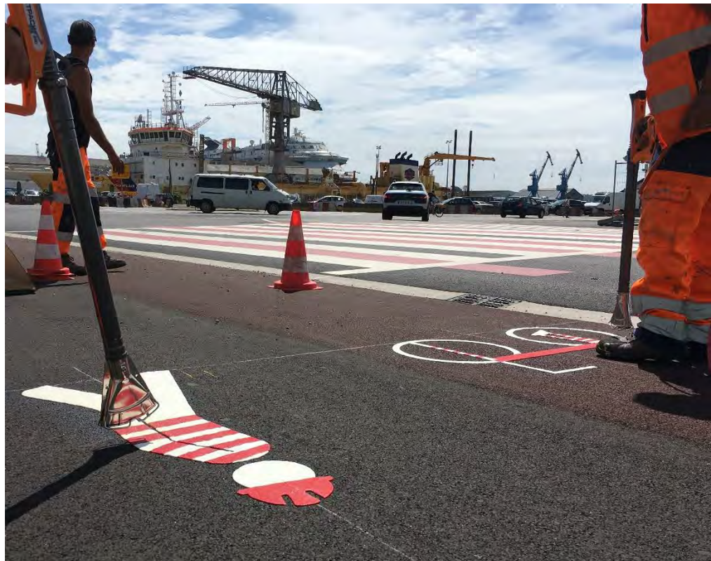
Marquage d'animation du boulevard des Apprentis à Saint-Nazaire, Ateliers UP+ pour la CARENE