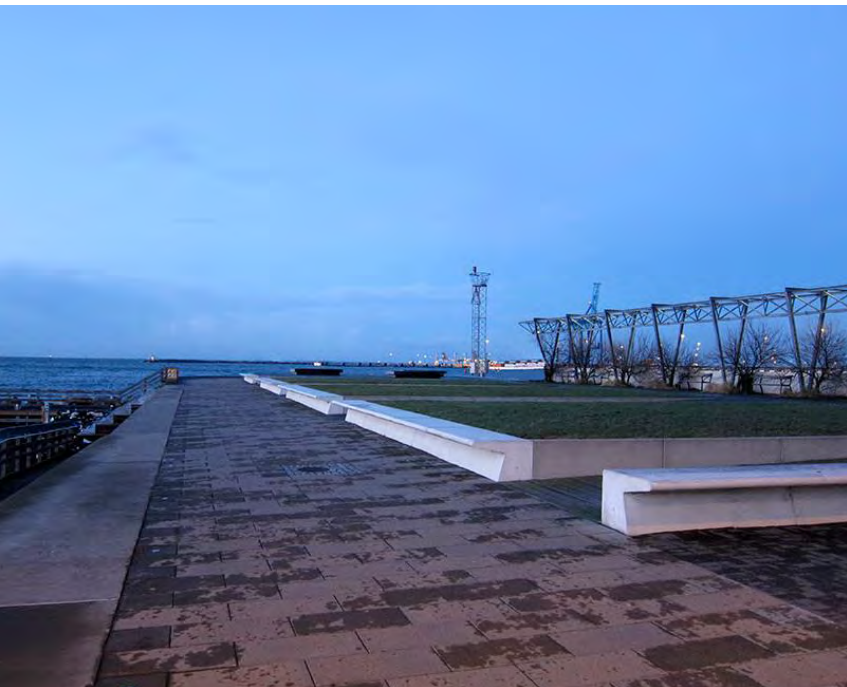
Western Harbour, Malmö Sydväst arkitektur och landskap

Donner de la qualité et de l'attrait à la promenade Aménager des lieux de détente et de contemplation