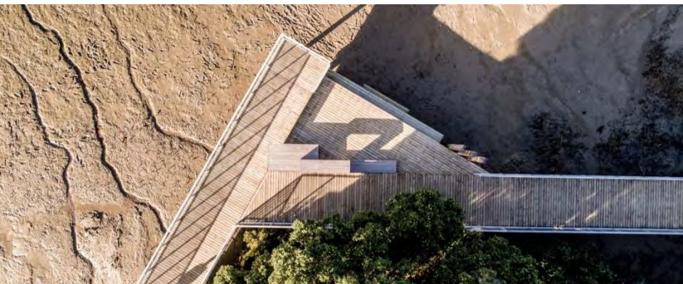
Port d'Hobsonville, Auckland Te Ara Manawa

Donner de la qualité et de l'attrait à la promenade Aménager des lieux de détente et de contemplation