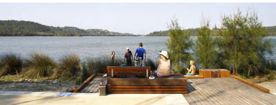
Narrabeen Lagoon, Sydney Aspect studios